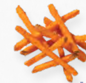
BATATA DOCE PALITOS PRÉ-FRITA