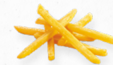
BATATA PRÉ-FRITA 7/7