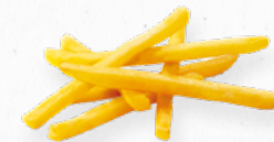
BATATA PRÉ-FRITA 8/8