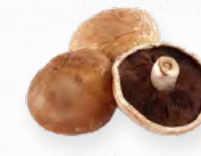
COGUMELOS PORTOBELLO 119.016 Kg