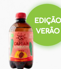
KOMBUCHA PÊSSEGO 🛒 316.0023 (PET) Cx. 12*400ml