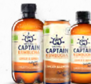
KOMBUCHA GENGIBRE & LIMÃO GC 🛒 316.0011 (Lota) Cx. 12*250ml 🛒 316.0021 (PET) Cx. 12*400ml 🛒 316.0031 (Vidro) Cx. 12*300ml