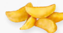
BATATA GOMOS S/PELE