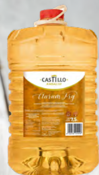
ÓLEO ALTO RENDIMENTO CASTILLO 🛒 303.0106 Cx. 2*7,5L

Rentabilize as suas frituras com óleos alto rendimento Sem espuma, menos fumo e mais crocância