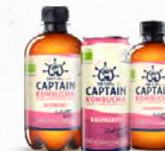
KOMBUCHA FRAMBOESA GC 🛒 316.0012 (Lota) Cx. 12*250ml 🛒 316.0022 (PET) Cx. 12*400ml 🛒 316.0032 (Vidro) Cx. 12*300ml