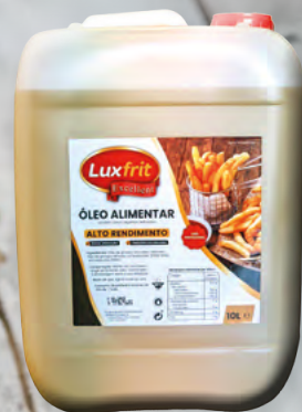
ÓLEO LUXFRIT EXCELLENT 🛒 303.0103 10L

Adicione frescura ao seu menu com as nossas bebidas