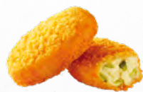
JALAPENOS BITES C/CREME DE QUEIJO * 🛒 606.0011 Cx. 6*1Kg