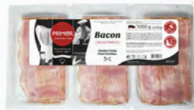
BACON FATIADO 508.0021 EMB. 500gr*2