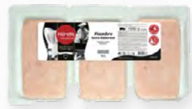
FIAMBRE FATIADO 508.0029 EMB 3*350g