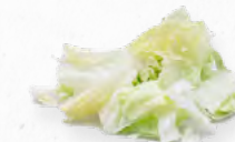
ALFACE ICEBERG 207.0010 1*500gr