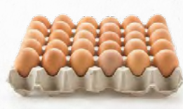
OVOS COM CASCA M/L 315.0000 Cx.15 DÚZIAS 315.0050 Cx.15 DÚZIAS