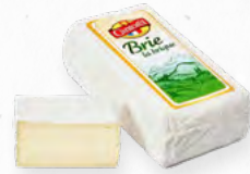
QUEIJO BRIE BARRA CANTOREL 507.0085 2*700gr