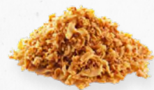
CEBOLA FRITA 390.0006 Cx.10*500grs