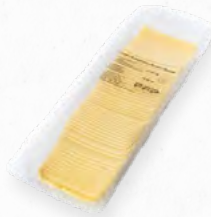
QUEIJO EDAMER FATIADO 507.0020 EMB 1Kg