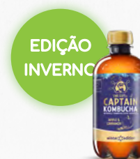
KOMBUCHA MAÇÃ & CANELA 🛒 316.0024 (PET) Cx. 12*400ml