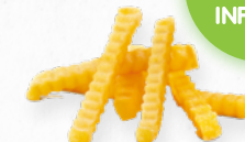
BATATA PRÉ-FRITA CRINKLE