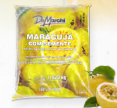
POLPA DE MARACUJÁ C/ SEMENTES * 🛒 612.0151 EMB. 1Kg