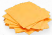
QUEIJO CHEDDAR FATIAS 507.0035 EMB. 1Kg