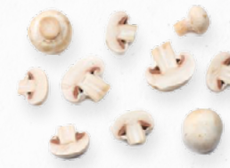
COGUMELOS LAMINADOS 119.010 Cx 3Kg