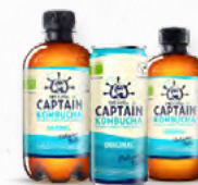
KOMBUCHA ORIGINAL GC 🛒 316.0010 (Lota) Cx. 12*250ml 🛒 316.0020 (PET) Cx. 12*400ml 🛒 316.0030 (Vidro) Cx. 12*300ml