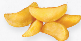
BATATA GOMOS S/PELE 601.0320 Cx. 4*2,5Kg