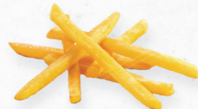
BATATA PRÉ-FRITA 7/7 601.0102 Cx. 5*2,5Kg