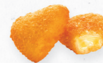
BRIE BITES 606.0008 Cx. 6*1Kg