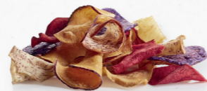
CHIPS | BATATA DOCE EXTRA FINAS SPALL'S 312.0008 Cx.16*200g