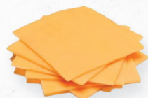
QUEIJO CHEDDAR FATIAS

Crie hamburguers para todos os paladares