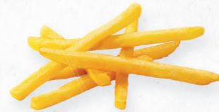
BATATA PRÉ-FRITA 8/8 501.0100 Cx. 2*5Kg

Adicione orégãos após a fritura para intensificar o sabor e conferir um toque de frescura!