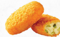
JALAPENOS BITES C/CREME DE QUEJO 606.0011 Cx. 6*1Kg