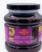
CEBOLA CARAMELIZADA C/VIN.BALS. E V.PORTO