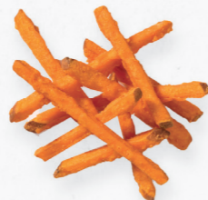
BATATA DOCE PALITOS PRÉ-FRITA 601.0003 Cx. 5*2Kg