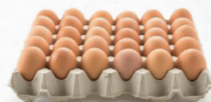
OVOS COM CASCA M/L