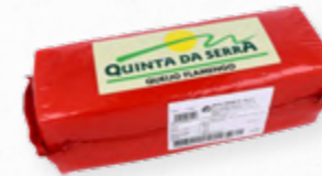
QUEIJO BARRA FLAMENGO