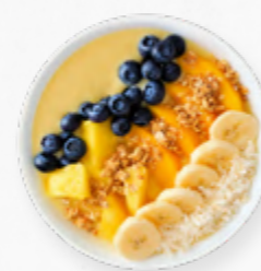
SM84 BOWLS TROPICAL BREAKFAST * 619.0051 Cx. 33*150g

Pedaços de açai, mirtilo, manga, morango e sementes diversas. Para preparar com leite ou bebida vegetal.