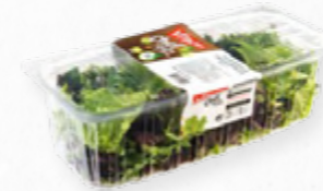
SALADA MESCLUM BIO 206.0018 EMB. 250g Composta por uma seleção de pelo menos três folhas baby diferentes, da época.