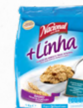
FLOCOS DE ARROZ E TRIGO INTEGRAL