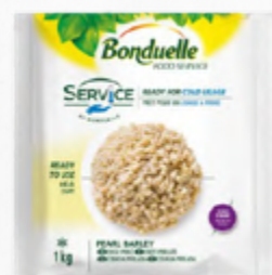
CEVADA COZIDA ✨ 🛒 620.0003 EMB. 1Kg