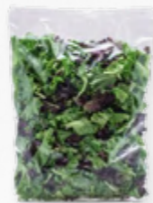
SALADA IBÉRICA FSTK 206.0007 EMB. 250g Composta por folhas baby de alface verde, folhas baby de alface roxa e rúcula.