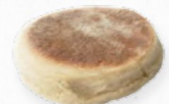
BOLO DE CACO * 613.0055 Cx. 100*100g