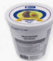
WESTERN GUACAMOLE ✨ 🛒 612.0055 Cx6 *1kg