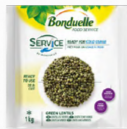
LENTILHAS VERDES ✨ 🛒 620.0002 EMB. 1Kg