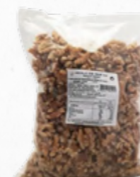
MIOLO DE NOZ QUARTOS