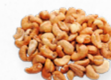
MIOLO DE CAJU TORRADO