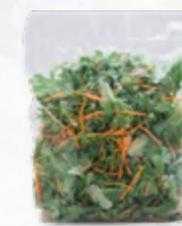
SALADA PREMIUM FSTK 206.0012 EMB. 250g Composta por multifolha verde e cenoura ripada.