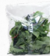
SALADA FORMOSA FSTK 206.0019 EMB. 150g Composta por alface frisada verde, packchoi vermelha, rúcula selvagem, salicórnia e acelga.