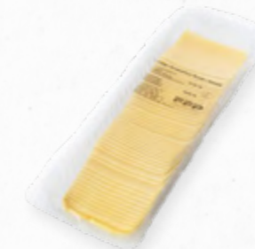
QUEIJO EDAMER FATIADO