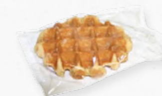
WAFFLES * 613.0075 Cx. 30*90g