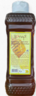
MEL TOP 313.0318 2.25Kg