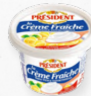
NATA FRESCA / CRÈME FRAÎCHE 30% 502.0009 EMB. 200gr % gordura 30%