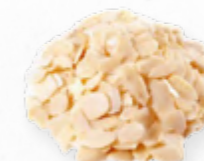
MIOLO DE AMÊNDOA LAMINADA