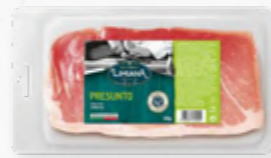
PRESUNTO FATIADO CLÁSSICO 508.0000 EMB. 500g