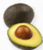
PÊRA ABACATE HASSE