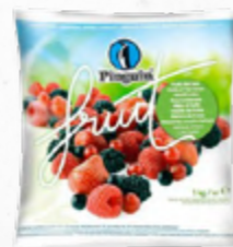
MIX FRUTAS DO BOSQUE IQF * 612.0070 EMB. 1 Kg