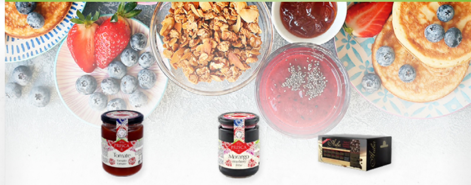
DOCE FRUTOS VERMELHOS CASA DA PRISCA 313.0303 Cx. 6*450gr

Pedaços de morango, amoras, framboesas, mel, baunilha e aveia sem glúten. Para preparar com leite ou bebida vegetal.