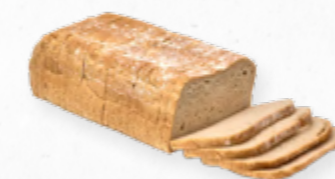
PÃO DE FORMA RÚSTICO * 613.0026 Cx. 2*2Kg