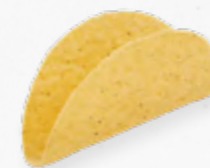
TACO SHELL * 319.0020 Cx. 10*240g