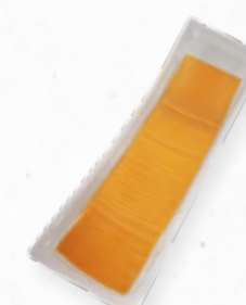
QUEIJO CHEDDAR FATIAS