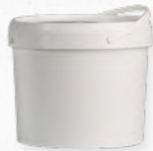
QUEIJO CREME (26% M.G)

🛒 507.0158 Balde 2Kg 🛒 507.0159 Balde 5Kg