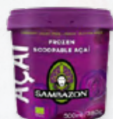
SAMBAZON AÇAÍ SORVETE BIO * 612.0203 Emb. 500ml