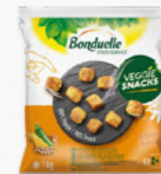
VEGGIE SNACK FALAFEL ✨ 🛒 616.0015 EMB. 1kg