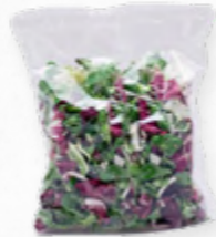
SALADA GOURMET FSTK 206.0004 EMB. 250g Composta por chicória, radicchio e canónigos.