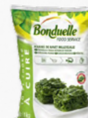
GRELOS MIL FOLHAS BONDUELLE