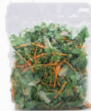
SALADA CAMPONESA FSTK 206.0002 EMB. 250g Composta por alface frisada, cenoura ripada, couve roxa ripada e milho doce.