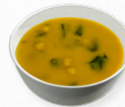
SOPA DE GRÃO COM ESPINAFRES 514.0005 BAG 2L