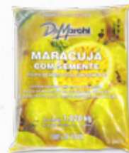
POLPA DE MARACUJÁ C/ SEMENTES * 612.0151 EMB. 1 Kg