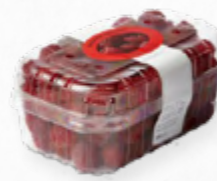
FRAMBOESA PREMIUM IQF * 612.0065 EMB. 500g.