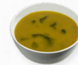
CREME DE CURGETE E ESPINAFRES S/BATATA 514.0007 BAG 2L