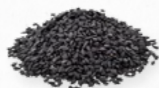
SEMENTES DE SÉSAMO PRETAS