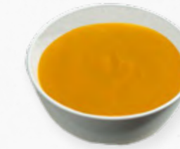
CREME DE CENOURA 514.0000 BAG 2L