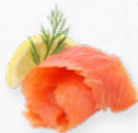
LASCAS DE SALMÃO FUMADO ALOHA 605.0020 EMB. 500g