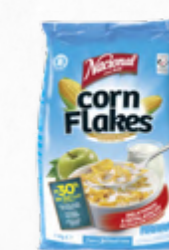
FLOCOS MILHO TOSTADOS