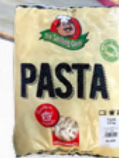
MACARRÃO COZIDO IQF ✨ 🛒 603.0051 Cx4 *1kg