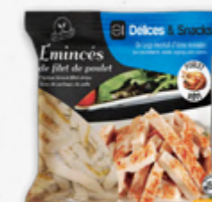
TIRAS DE FRANGO GRELHADO