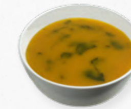
SOPA DE AGRIÃO 514.0001 BAG 2L