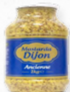
MOSTARDA DIJON ANCIENNE