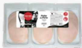
PEITO DE PERÚ FATIADO 508.0032 EMB. 3*250g