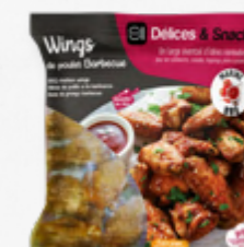
ASINHAS DE FRANGO BBQ