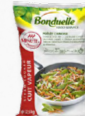
SALTEADO DE LEGUMES CHINÊS