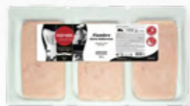
FIAMBRE FATIADO 508.0029 EMB. 3*350g