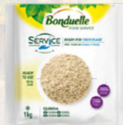
QUINOA COZIDA ✨ 🛒 620.0001 EMB. 1Kg