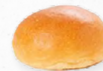
PÃO BRIOCHE * 613.0051 Cx. 20*70g