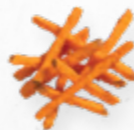
BATATA DOCE PALITOS PRÉ-FRITA ✱ 601.0003 Cx. 2*5kg