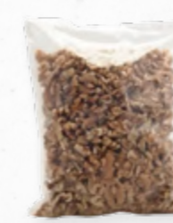
MIOLO DE NOZ METADES