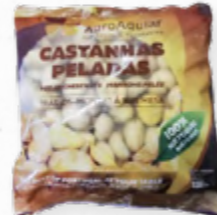
IQF CASTANHA PELADA IQF * 612.0075 EMB. 1 Kg