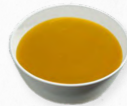
CREME DE LEGUMES COM BATATA 514.0006 BAG 2L