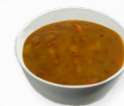
SOPA DE FEIJÃO E LEGUMES 514.0003 BAG 2L