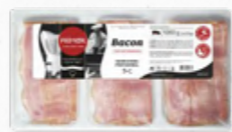
BACON FATIADO 508.0021 EMB. 3*350g