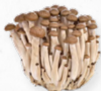
COGUMELOS SHIMEJI MARROM