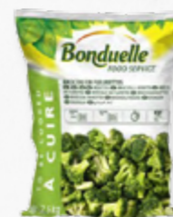
BRÓCOLOS BONDUELLE CONG.