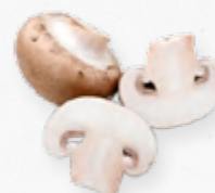
COGUMELO PARIS EMB