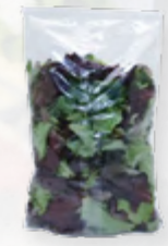
SALADA RIVA 206.0015 EMB. 250g Composta por folhas baby de alface verde e alface roxa.