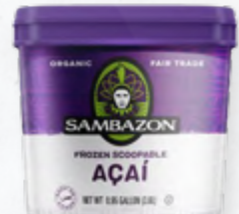
SAMBAZON AÇAÍ SORVETE BIO * 612.0202 Balde 3.6Lt