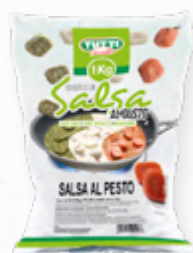
MOLHO PESTO CUBOS