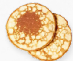
MINI-PANQUECA AMERICANA * 613.0090 Cx. 100*25g