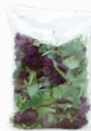
SALADA AROMÁTICA 206.0000 EMB. 250g Composta por multifolha verde, multifolha roxa e coentros.

Folhas e legumes lavados, cortados e higienizados