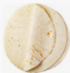
WRAP 25CM TRIGO 613.0060 cx 8*(18*68.89g)