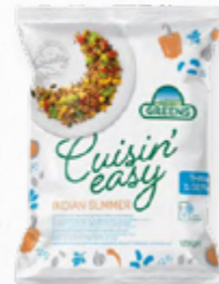
SALADA INDIAN SUMMER ✨ 🛒 618.0003 EMB 750GR Salada de quinoa e legumes num molho de caril