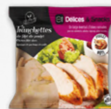
PEITO DE FRANGO FATIADO