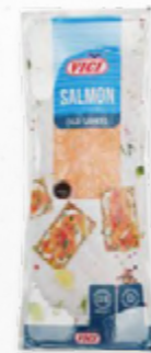
SALMÃO FUMADO 605.0000 EMB.de apr. 1 Kg