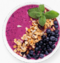
SM84 BOWLS BERRY OATS BREAKFAST * 619.0053 Cx. 33*150g

Pedaços de banana, coco, ananás e sementes diversas. Para preparar com leite ou bebida vegetal.