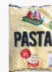
PENNE COZIDO IQF TP ✨ 🛒 603.0055 EMB. 2.5kg