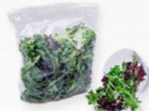
SALADA MESCLA FSTK 206.0010 EMB. 250g Composta por multifolha verde, multifolha roxa e rúcula.