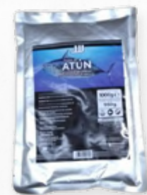
ATUM BOLSA 304.0603 1 Kg (950g p.e)