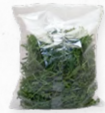
RUCULA SELVAGEM FSTK 207.0052 EMB. 250g Composta por alface iceberg, lololo rosso, alface chicória.