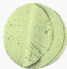
WRAP 25CM ESPINAFRE 613.0070 cx 8*(18*68.89g)