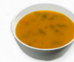
SOPA DE FEIJÃO VERDE 514.0004 BAG 2L