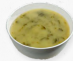
CALDO VERDE S/CHOURIÇO 514.0008 BAG 2L