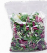
SALADA MIX FOR FUN 206.0011 EMB. 250g Composta por alface frisada ou lollo biondo, alface chicória frisada e radicchio.