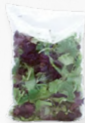
SALADA LOLLO TANGO FSTK 206.0008 EMB. 250g Composta por multifolha verde e multifolha roxa.