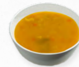
SOPA DE LEGUMES 514.0002 BAG 2L