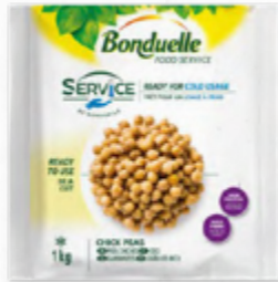
GRÃO DE BICO COZIDO ✨ 🛒 620.0004 EMB. 1Kg