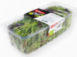
SALADA BISTROT 206.0001 CX 5x350g Composta por alface frisada verde, pak choi vermelha, rúcula e acelga.