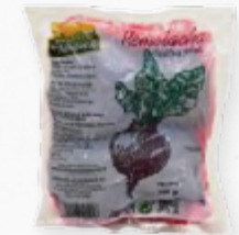
BETERRABA COZIDA 203.0003 EMB. 250g