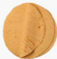
WRAP 25CM TOMATE 613.0065 cx 8*(18*68.89g)