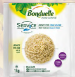
BULGUR COZIDO ✨ 🛒 620.0000 EMB. 1Kg