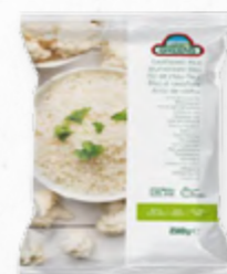
ARROZ DE COUVE-FLÒR

Edamame também conhecido como fava de soja