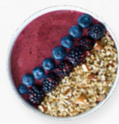
SM80 BOWLS AÇAÍ BREAKFAST * 619.0050 Cx. 33*150g

Pedaços de açai, mirtilo, manga, morango e sementes diversas. Para preparar com leite ou bebida vegetal.