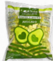
ABACATE EM CUBOS IQF * 612.0053 Cx. 61 kg