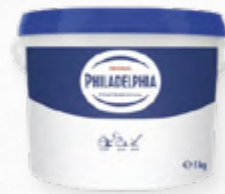
QUEIJO PHILADELPHIA REG.

🛒 507.0158 Balde 2Kg 🛒 507.0159 Balde 5Kg