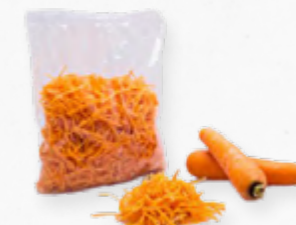
CENOURA RIPADA 203.0203 EMB. 200g