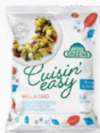
SALADA BELLA CIAO ✨ 🛒 618.0002 EMB 750GR Massa com mozzarella, parmesão e pesto.