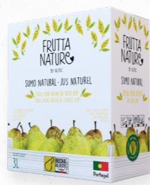
PÊRA ROCHA DO OESTE