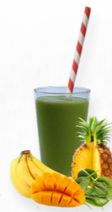
SM32 MORNING GLORY * 619.0009 Cx 33*150g

Um smoothie de pêra, abacate, kiwi, hortelã e maçã, fresco e delicioso