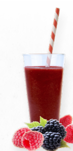
SM8 MAD BERRIES * 619.0001 Cx 33*150g

Um smoothie clássico mas sempre delicioso de morango e banana