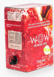
NFC SUMO DE MAÇÃ 316.0052 5L

Um smoothie de ananás, papaia, maracujá e cenoura que é rico em beta-caroteno, vitaminas e minerais