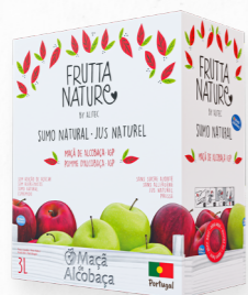
MAÇÃ DE ALCOBAÇA

Sumos exclusivamente feitos de fruta espremida, criteriosamente selecionada a partir das melhores origens