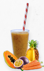
SM44 CARROT PASSION * 619.0012 Cx 33*150g

Um smoothie de gengibre, sementes de cânhamo, limão, matcha, pêra e espinafres, uma combinação única, fresca e delicioso com propriedades saudáveis e antioxidantes