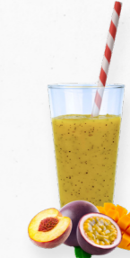
SM28 TROPICAL DELIGHT * 619.0006 Cx 33*150g

Um smoothie antioxidante e repleto de nutrientes com manga, mirtilo, morango e açaí