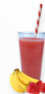
SM7 XTRA-ENERGY * 619.0000 Cx 33*150g

Um smoothie clássico mas sempre delicioso de morango e banana