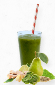
SM38 GREEN GODDESS * 619.0017 Cx 33*150g

Um smoothie de maçã, limão, gengibre, espinafre e cenoura, uma mistura delicada de frutas e vegetais com um apontamento picante