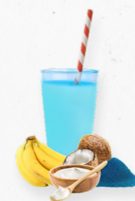
SM17 BLUE BEAUTY * 619.0016 Cx 33*150g

Um smoothie com spirulina azul, banana, iogurte e coco