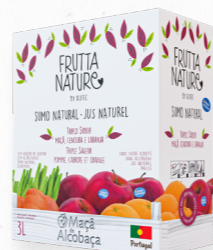
MAÇÃ ALCOBAÇA, CENOURA, LARANJA