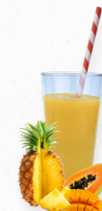
SM11 TROPICAL TWIST * 619.0004 Cx 33*150g

Um delicioso smoothie com meloa, morango e manga