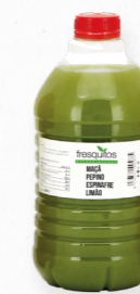
MAÇÃ PEPINO, ESPINAFRE, LIMÃO