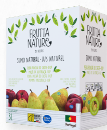
PÊRA ROCHA, MAÇÃ ALCOBAÇA