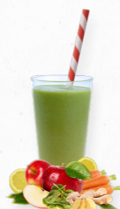
SM34 VEGGIE TWIST * 619.0015 Cx 33*150g

Um smoothie de beterraba, framboesa e banana fonte de magnésio, potássio, ácido fólico e antioxidante que fortalece o sistema imunitário