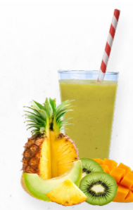
SM9 TROPICAL TANGO * 619.0002 Cx 33*150g

Um smoothie repleto de nutrientes com framboesas, amora e morangos