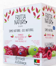
MAÇÃ ALCOBAÇA, FRAMBOESA