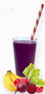
SM33 BEET & BLEND * 619.0010 Cx 33*150g

Um smoothie detox de manga, espinafres, ananás e banana que é fonte de minerais e vitamina C