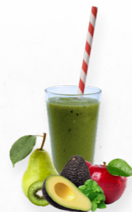
SM31 MIGHTY GREEN * 619.0008 Cx 33*150g

Um smoothie fresco de morango, ananás e coco