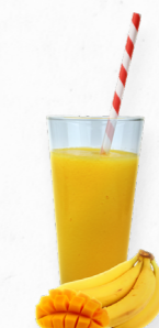
SM15 MANGO LOVER * 619.0013 Cx 33*150g

Um smoothie impulsionador de imunidade com manga, papaia e abacaxi repleto de vitaminas, cálcio, magnésio e ferro