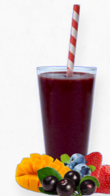
SM26 JUNGLE JUICE * 619.0005 Cx 33*150g

Um smoothie com spirulina azul, banana, iogurte e coco