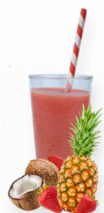
SM29 CARIBEEEN BREEZE * 619.0007 Cx 33*150g

Um smoothie fresco de morango, ananás e coco