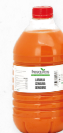
LARANA, CENOURA, GENGIBRE