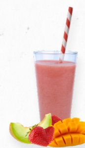
SM10 SWEET MELODY * 619.0003 Cx 33*150g

Um smoothie tropical com meloa, ananás, kiwi e manga